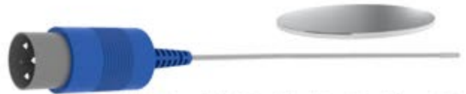
DIN 3 pim muadili enjeksiyonlu konektör, 155 cm kablo uzunluğu