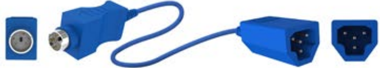
Mini DIN 5 pim muadili enjeksiyonlu konnektör

OEM P/N: MU12520x (Air Shields – Dräger)