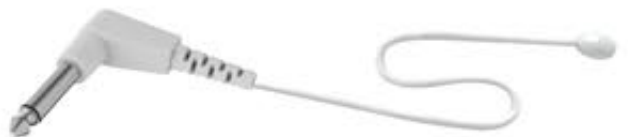
6.35 mm (1/4") tekli jak, enjeksiyonlu konektör, Ø 10mm disk

Ohmeda / Ohio 190, 190A and 190ASC Kuvöz ve Bebek Isıtıcıları