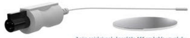
3 pim enjeksiyonlu konektör, 155 cm kablo uzunluğu