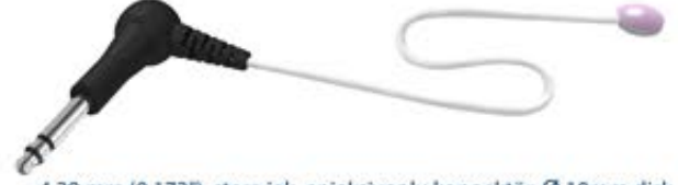
4.39 mm (0.173") stero jak, enjeksiyonlu konnektör, Ø 10mm disk

Fisher & Paykel Healthcare IW 910 / IW 920 / IW930 CosyCot / IW931 / IW932 / IW933 / IW934 / IW950 CosyCot / IW980 / 990 Bebek Isıtıcıları.