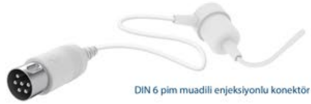
DIN 6 pim muadili enjeksiyonlu konektör

Air Shields Kuvöz; C-400QT *, C-450QT *, C-500QT, C-500QT– Model XL. (* Bu modeller için iki tür yardımcı hava probu mümkündür lütfen konektör tipini kontrol ediniz.)