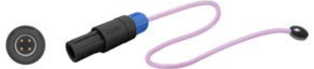
REDEL 4 pin çift kanal 60° konnektör, Ø 10mm disk

Mediprema Satis 3552 / 3555, Kuvöz. Fabie Bebek Isıtıcısı, Ambia 435x Radyant Isıtıcı.