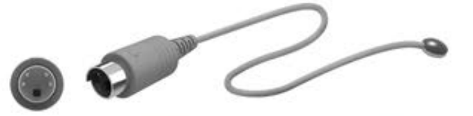
Mini DIN 4 pim enjeksiyonlu konektör, Ø 10mm disk

Ningbo David Medical YP-2000 / 970 / 930 / 920 / 910 / 90 / 90A / 90B / 90AB / 100 / 100A / 100B / 100AB, HKN-93 / 93A / 93B / 9010 / 2000 / 90 Kuvözleri ve Bebek Isıtıcıları.