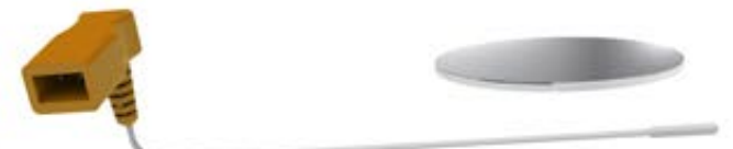
2 pim dikdörtgen dirsek konektör, 75 cm kablo uzunluğu