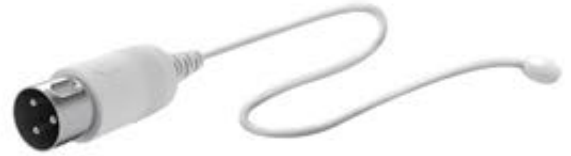
DIN 3 pim muadili enjeksiyonlu konektör, Ø 10mm disk

Air Shields Kuvöz; C-100, C-100QT, C-450QT, C550 QT, C550 QT – Model XL, Bebek yoğun bakım sistemleri; 78-000-50, 78-001-70, 78-280-70, 78-070-70, Bebek ısıtıcıları; 78-270-70, 78-275-70, Taşıma odaları; 78-285-75, 78-285-70, Doğumhane ısıtıcısı; 78-290-70.