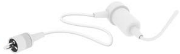
DIN 2 pim muadili enjeksiyonlu konektör

C-100, C-100QT, C-200, C-200QT, C-400QT *, C-450QT * (* Bu modeller için iki tür yardımcı hava probu mümkündür lütfen konektör tipini kontrol ediniz.)