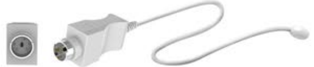
Mini DIN 5 pim muadili enjeksiyonlu konnektör, Ø 10mm disk

Air Shields Isolette C2000 Incubators and Versalet 7700 Bakım Üniteleri.