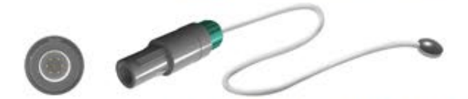
REDEL 6 pim tek kanal konektör, Ø 10mm disk

Ningbo David Medical HKN-93 / 93A / 93B / 9010 / 2000 / 90 Bebek Isıtıcıları.