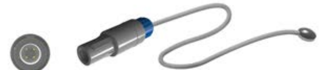
REDEL 4 pim tek kanal konektör, Ø 10mm disk

Ningbo David Medical YP-2000 / 970 / 930 / 920 / 910 / 90 / 90A / 90B / 90AB / 100 / 100A / 100B / 100AB Kuvözleri.