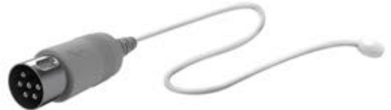
DIN 6 pim muadili enjeksiyonlu konektör, Ø 10mm disk

Air Shields - Hill Rom – Drager ; Resuscitaire Bebek Isıtıcıları.